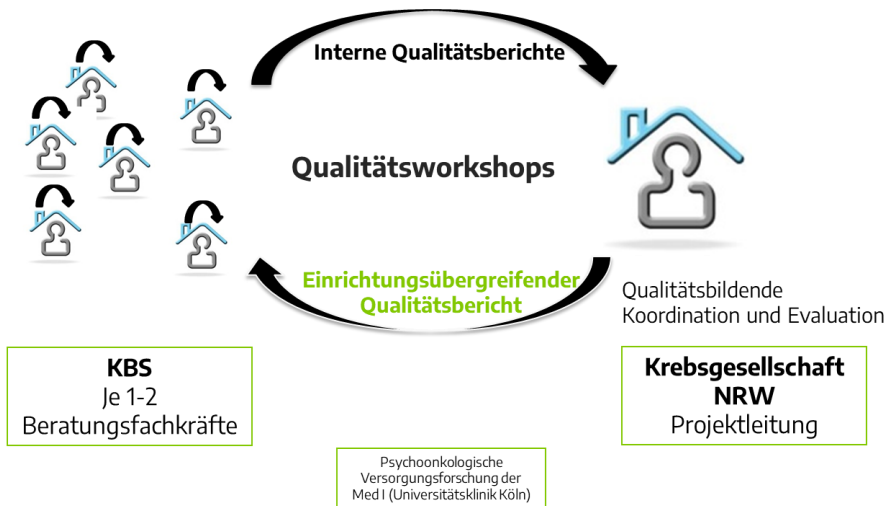
Abb. 3 Qualitätsworkshops im QV-KB-NRW (eigene Darstellung)

Die beratungsrelevanten Schwerpunkte zur Qualitätssicherung und -verbesserung werden in regelmäßigen Qualitätsworkshops (QWS) bearbeitet, deren Zusammensetzung die skizzierten drei Komponenten des Verbundes widerspiegelt.