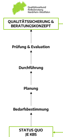
Abb. 4 Bottom-Up-Arbeitsweise im QV-KB-NRW (eigene Darstellung)

Bedarfsbestimmung: In dieser Phase ist die Frage zu beantworten, was benötigt wird, um die Qualität der psychosozialen Krebsberatung zu verbessern bzw. „gute Beratungspraxis“ zu erreichen. Bedarf ist das, was die Zielgruppe (hier: KBS-Mitarbeiter*innen) braucht, um